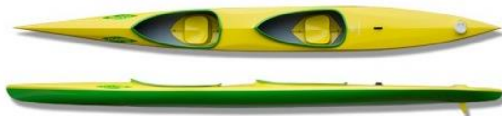
MINI K2 KAPE - poids : 17kg, charge maxi 100kg, longueur : 550cm

Le compromis glisse-stabilité est parfait, les jeunes se font immédiatement plaisir avec ces bateaux à leur taille. La fabrication en polyester est particulièrement robuste, les bateaux sont équipés de caissons avant et arrière, et d'une protection pour le gouvernail.