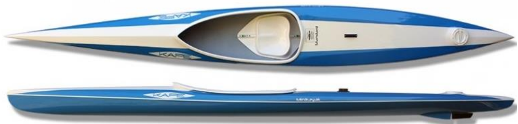
MINI K1 KAPE - poids : 11kg, charge maxi 50kg, longueur : 420cm