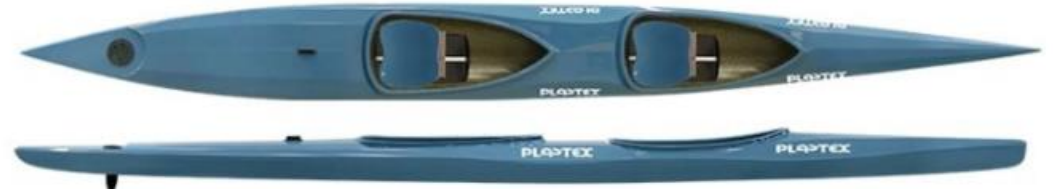
MINI K2 PLASTEX - poids : 15kg, charge maxi 100kg, longueur : 550cm, largeur 50cm