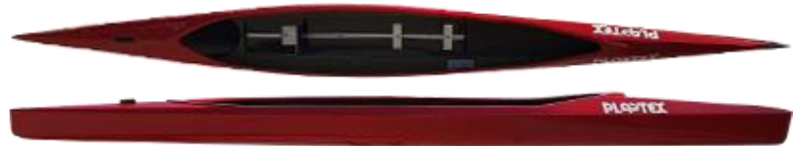
MINI C1 CADET – poids : 10kg, charge maxi 50kg, longueur : 420cm