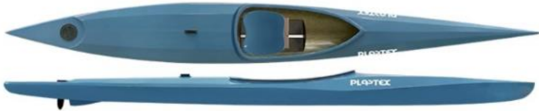
MINI K1 PLASTEX - poids : 10kg, charge maxi 50kg, longueur : 420cm, largeur : 47cm