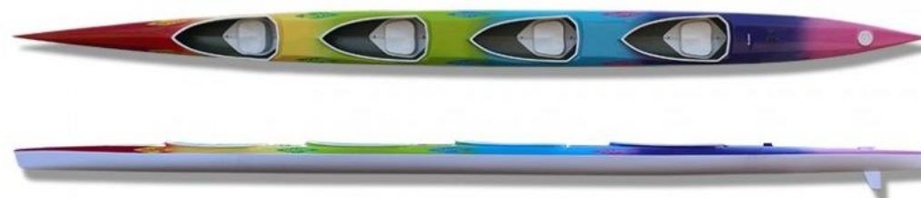
MINI K4 KAPE - poids : 30kg, charge maxi 220kg, longueur : 850cm