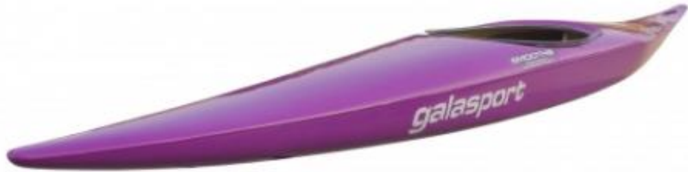
C1 SLALOM SMOOTHIE – poids du pagayeur : 45 à 65kg