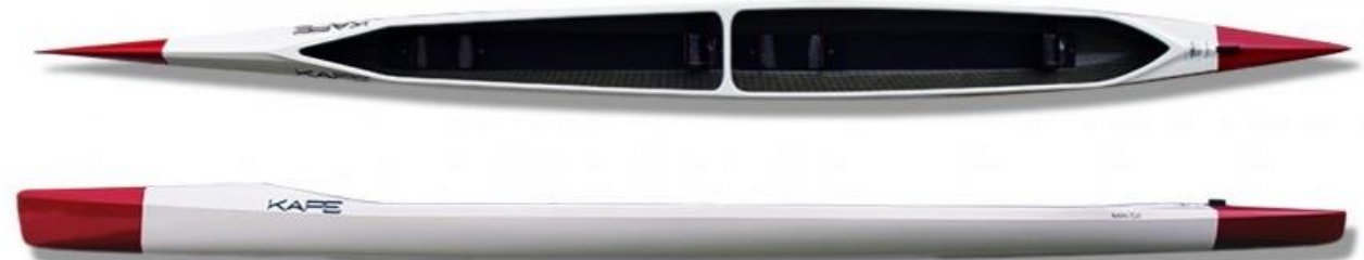
MINI C2 KAPE - charge maxi 60 à 100kg, longueur : 560cm, largeur : 42cm