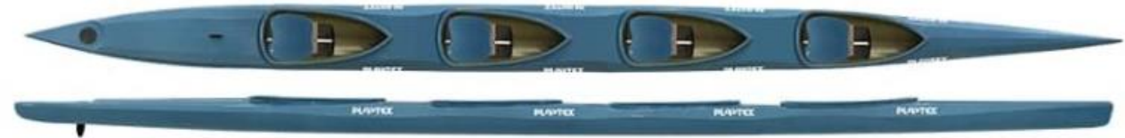
MINI K4 PLASTEX - poids : 30kg, charge maxi 220kg, longueur : 850cm, largeur : 50cm