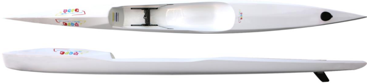
K1 FUTUREKIDS – poids : 9kg, charge maxi : 50kg, longueur : 420cm, largeur : 38cm