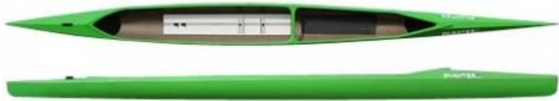
C1 CADET – poids : 14kg, charge maxi : 65kg, longueur : 420cm