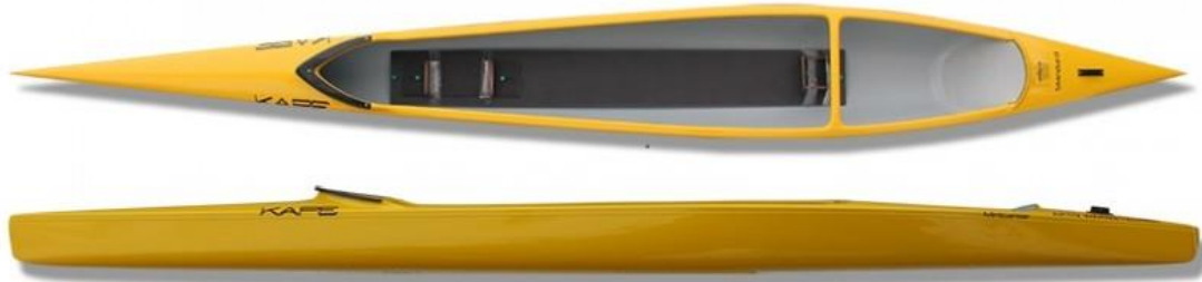
MINI C1 KAPE - charge maxi 40 à 70kg, poids : 13,5kg longueur : 460cm, largeur : 52cm