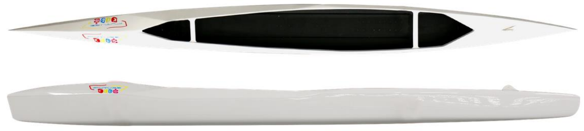
C1 FUTUREKIDS – poids : 10kg, charge maxi : 50kg, longueur : 420cm, largeur : 36cm