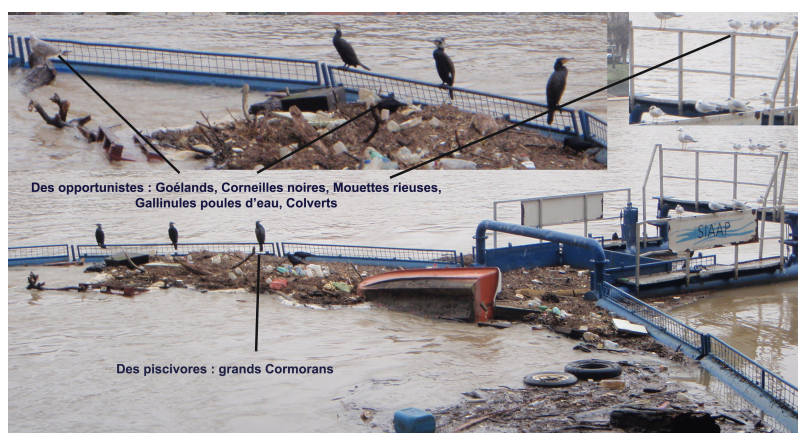
"Illustration 2" Faune et déchets Pierre Alain POINTURIER/FFCK

C'est ainsi que, en contact direct avec ces déchets organiques, on trouvera une faune abondante :