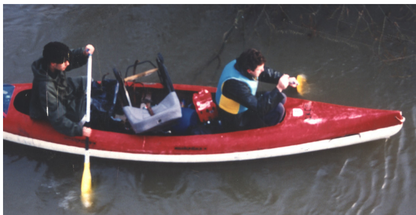
"Illustration 1" Bateau nettoyage