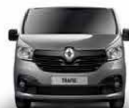
Bouclier avant semi-ton caisse