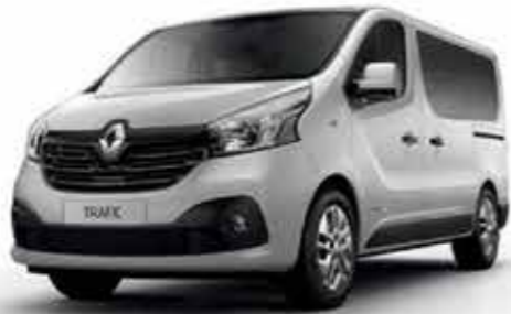
Blanc Glacier (OV 369)