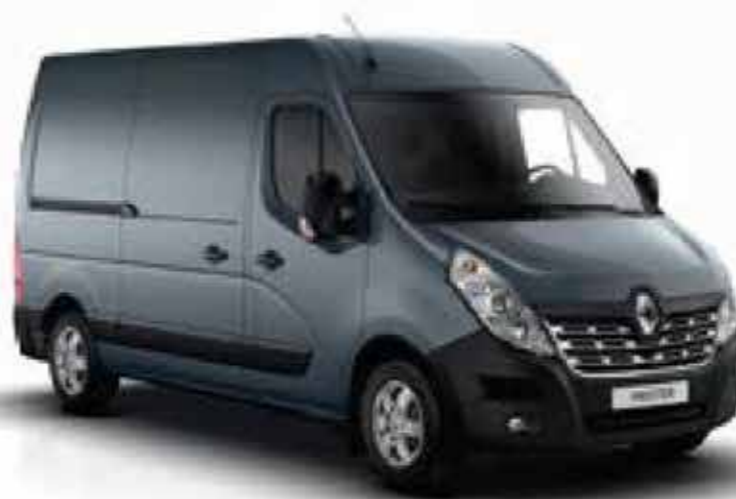
Bleu Gris (TE J47)