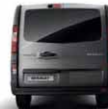
Colonnes latérales arrière noir grainé