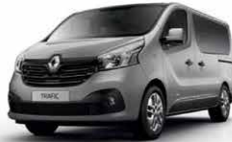
Gris Platine (TE D69)