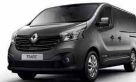
Gris Cassiopée (TE KNG)