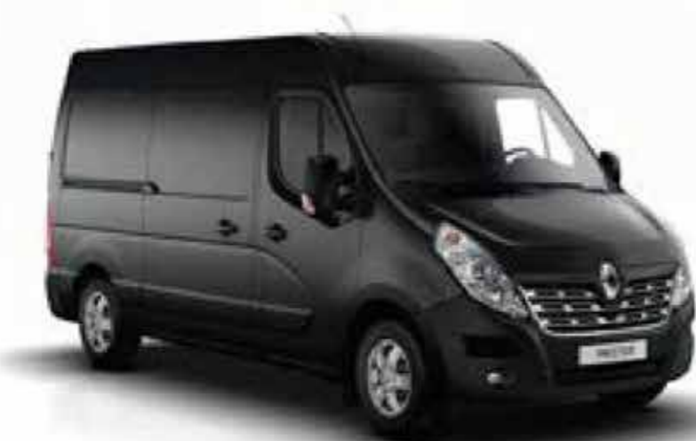
Noir Nacré (NV 676)