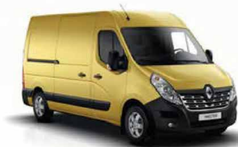
Jaune Citron (OV 396)