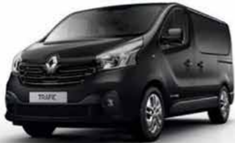
Noir Crépuscule (TE D68)