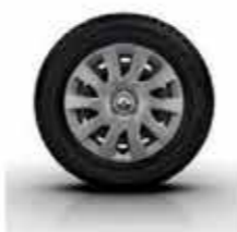
Enjoliveur 16" Maxi