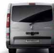
Hayon arrière vitré colonnes latérales arrière ton caisse