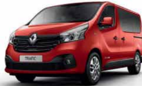
Rouge Magma (OV NNS)