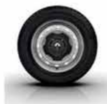
Enjoliveur 16" Mini