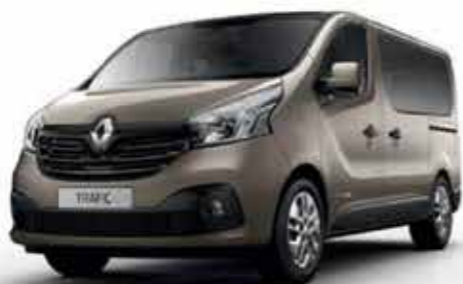
Beige Cendré (TE HNK)

OV : peinture opaque ; TE : peinture métallisée Photos non contractuelles.