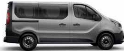
1 ou 2 portes latérales coulissantes court ou long