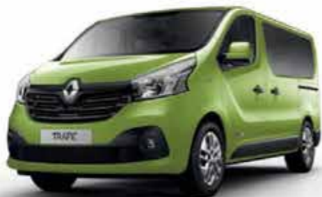
Vert Bambou (OV DPA)