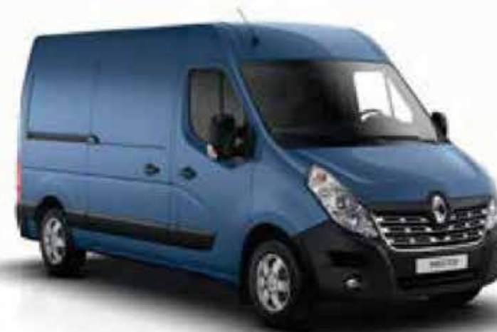
Bleu Myosotis (OV 489)