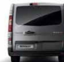
Colonnes latérales arrière ton caisse