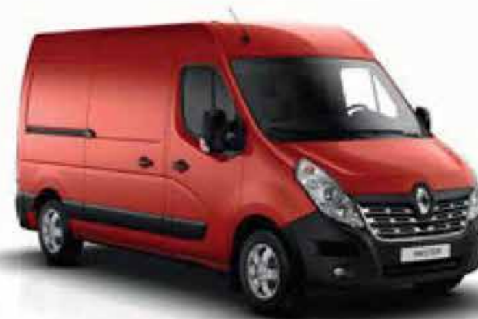
Rouge Vif (OV 719)