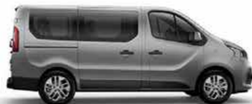
Cache-rail ton caisse