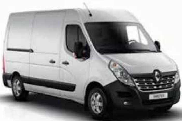
Blanc Glacier (OV 389)