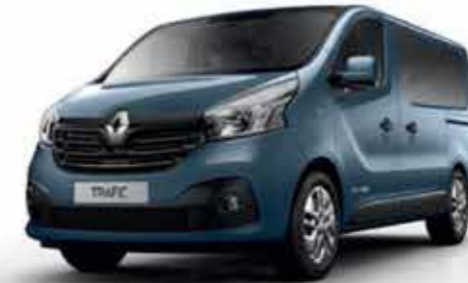
Bleu Panorama (TE J43)