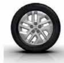
Jante alliage 17" Cyclade