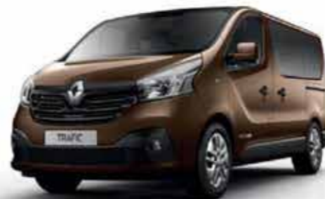
Brun Cuivré (TE CNH)