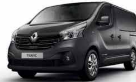
Gris Taupe (OV KPF)