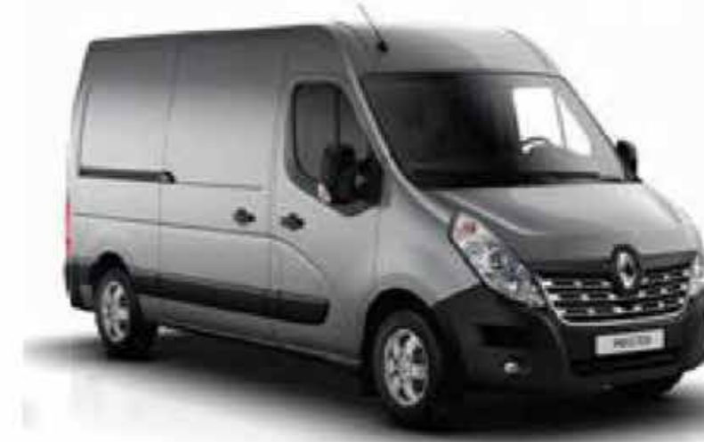
Gris Étoile (TE KNH)

OV : teinte opaque verni ; TE/NV : peinture métallisée (en option) D'autres teintes sont disponibles à la demande en contremarque. Les teintes Jaune Citron, Bleu Myosotis, Gris Etoile, Bleu Gris et Noir Nacré ne sont pas disponibles sur le niveau Générique. Photos non contractuelles.