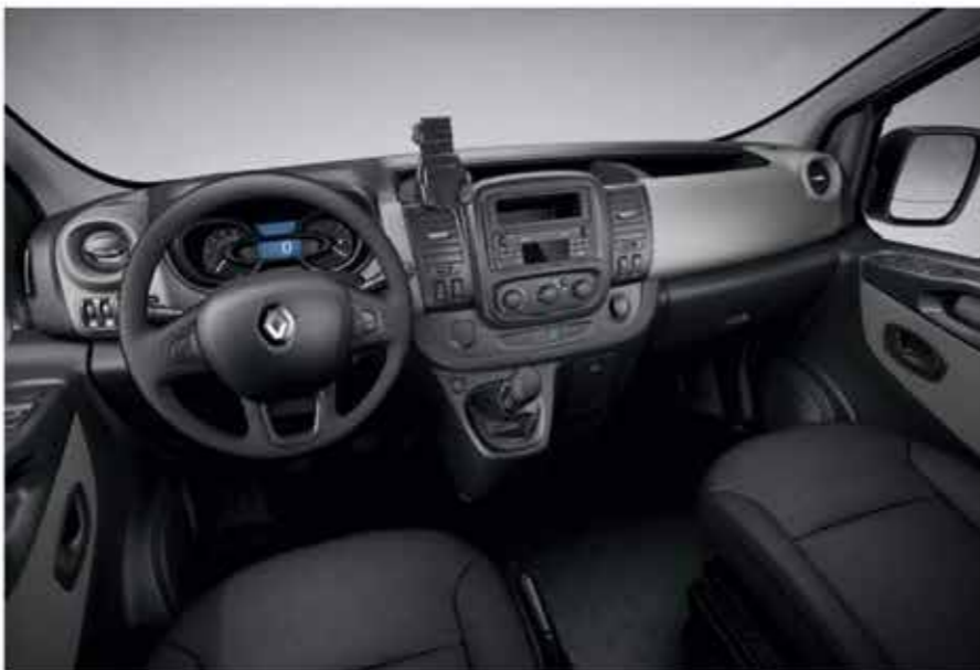
Visuel présenté avec l'option support Smartphone