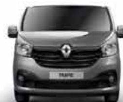
Bouclier avant semi-ton caisse, rétroviseurs ton caisse, Inserts chrome sur calandre et bandeau noir brillant