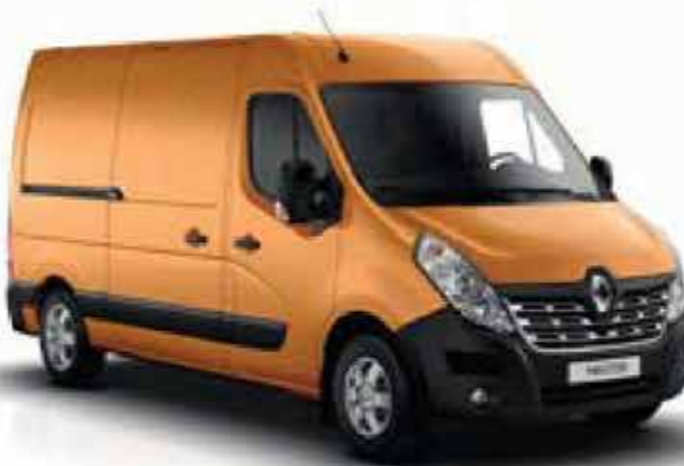
Orange (OV 031)