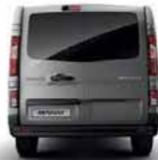
Portes 180° vitrées