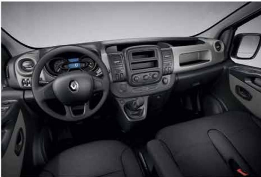
Visuel présenté sans l'équipement Airbag passager (de série)