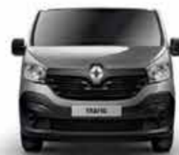
Bouclier avant noir grainé