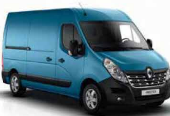
Bleu Saviem (OV 423)