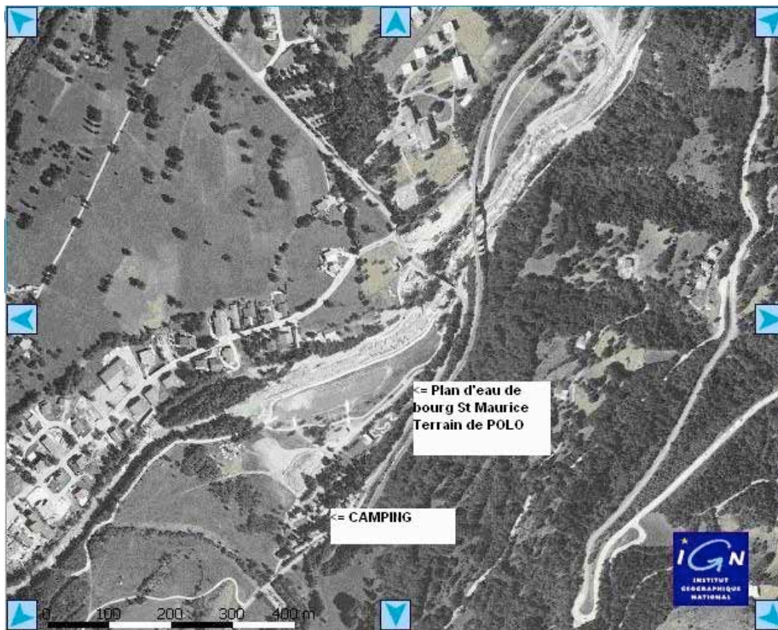
Situation du terrain du GOTARD