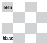
Pavillon N (damier bleu/blanc)