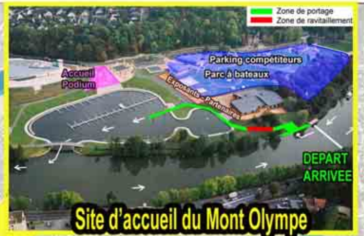
Site d'accueil du Mont Olympe